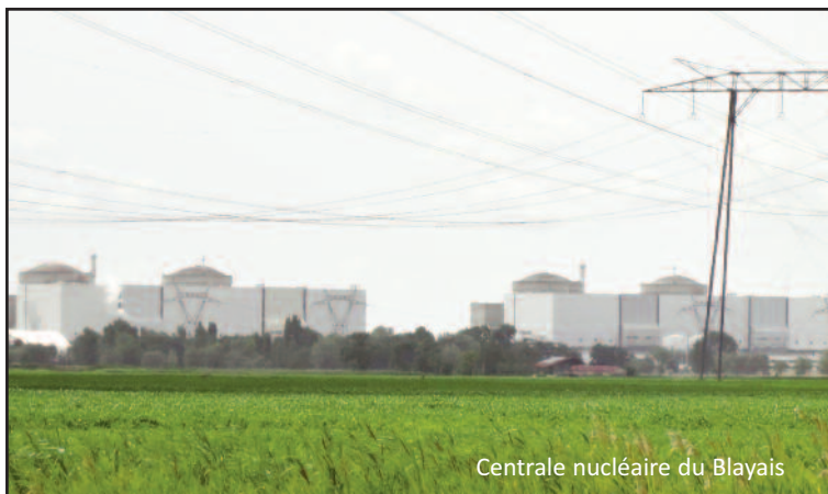
Centrale nucléaire du Blayais