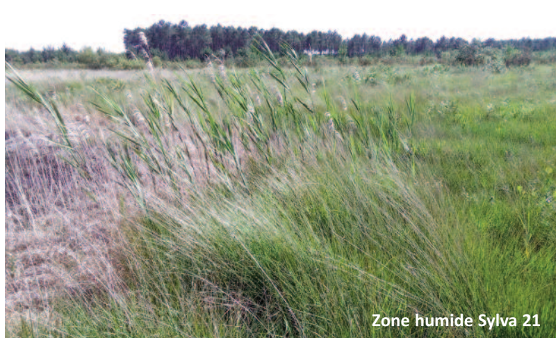
Zone humide Sylva 21

A proximité de l'autoroute A63 Bordeaux-Bayonne et à 1km de la Leyre, un terrain de plus de 19 ha sur la zone d'activité Sylva21 a été vendu par la communauté de commune Val de Leyre à un promoteur, le groupe Percier Réalisation Développement (PRD). Sur cette surface, environ 13 ha sont concernés par une zone humide d'après le Schéma d'Aménagement et de Gestion de l'Eau (SAGE Leyre). Les bâtiments occuperaient 7,1 ha sans compter les parkings. Le groupe PRD louerait ce bâtiment à une société pour stocker des marchandises et permettre à des camions circulant sur l'A63 de les répartir sur un vaste territoire. A la demande du promoteur, la structure a été classée ICPE ce qui permettrait au futur locataire de stocker des substances dangereuses pour l'environnement. Pour l'instant, le