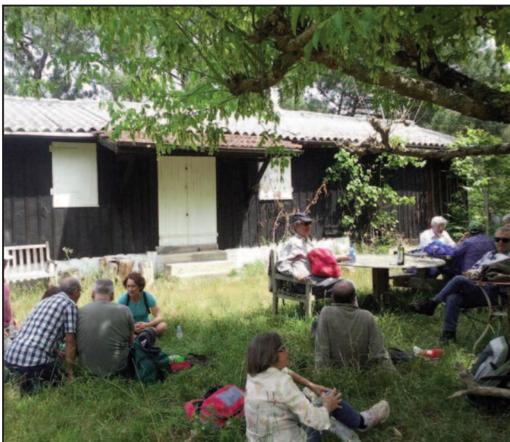
A l'heure du pique-nique devant la cabane de Batcoude