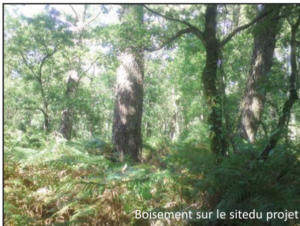
Boisement sur le site du projet